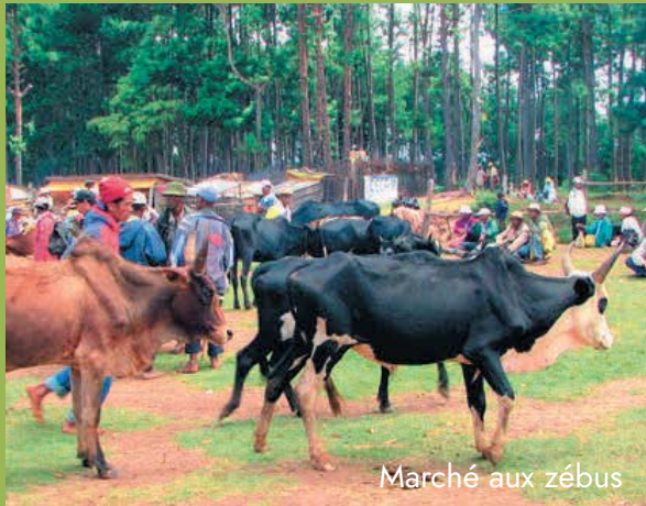
Marché aux zébus

missionnaires et les Malgaches chrétiens ont été persécutés par la reine Ranaivalona I re . C'est son fils, le roi Radama II, qui a rouvert le pays aux missionnaires. Madagascar a ensuite été une colonie française jusqu'à son indépendance le 26 juin 1960.