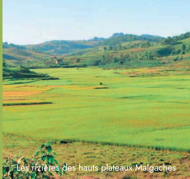
Les rizières des hauts plateaux Malgaches