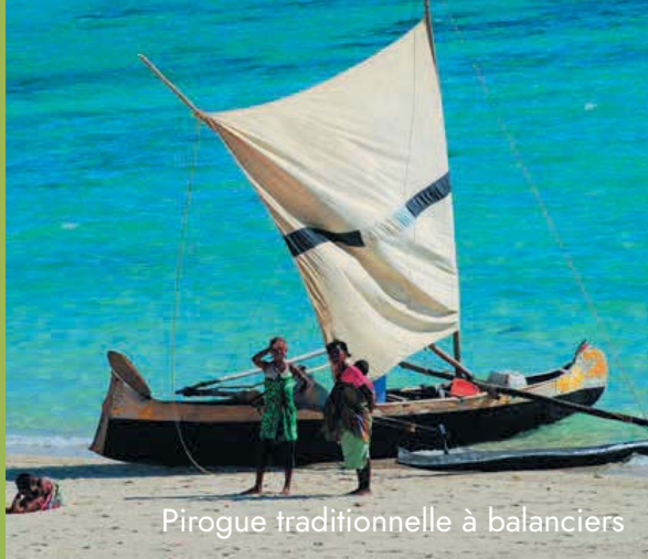
Pirogue traditionnelle à balanciers