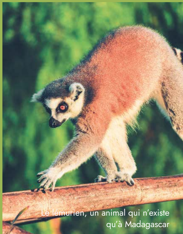
Le lémurien, un animal qui n'existe qu'à Madagascar

Aujourd'hui, la Grande Île vit principalement du tourisme, mais reste l'un des des pays les plus pauvres du monde. La crise du Covid 19 et les dernières tempêtes tropicales ont été de grandes épreuves pour les Malgaches.