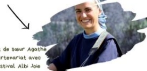
Concert de sœur Agathe en partenariat avec Le Festival Albi Joie

Pour tous les enfants des paroisses et des établissements catholiques (ce1, ce2, cm1) et leurs familles