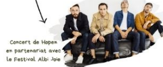
Concert de Hopen en partenariat avec Le Festival Albi Joie

Pour tous les jeunes des paroisses et des établissements catholiques (cm2, 6°, 5°) et leurs familles