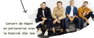
Concert de Hopen en partenariat avec Le Festival Albi Joie

Pour tous les jeunes des paroisses et des établissements catholiques (cm2, 6°, 5°) et leurs familles