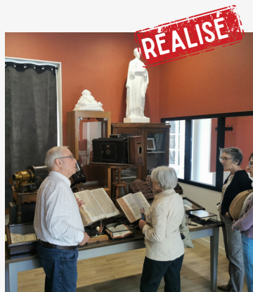
250 m 2 dédiés aux nouvelles archives

Le Foyer porte le nom d'un tout jeune bienheureux : Carlo Acutis, un adolescent italien décédé en 2006, impliqué dans sa scolarité, connu pour être un « geek de Jésus », et un jeune homme rayonnant de joie. Nous croyons que sa vie peut être une inspiration, un exemple, pour beaucoup de jeunes d'aujourd'hui !