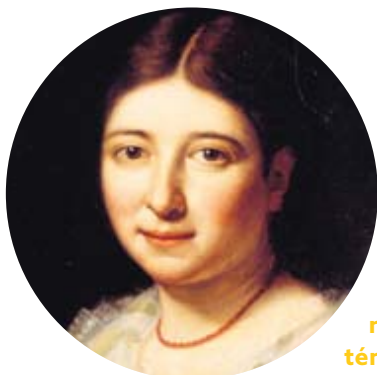
Portrait de Pauline-Marie Jaricot