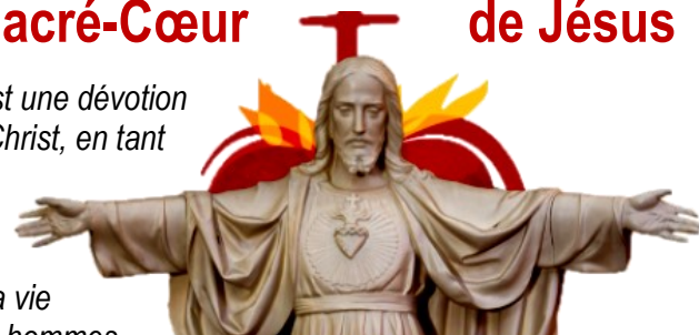
Fête le 4ème vendredi après Pâques (cette année le 24 juin)

Le Sacré-Cœur est une dévotion au cœur de Jésus-Christ, en tant que symbole de l'amour divin par lequel Dieu a pris la nature humaine et a donné sa vie pour les hommes.