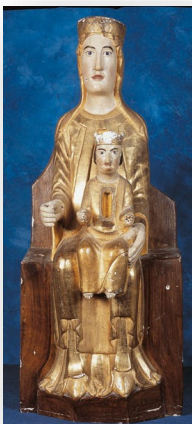
Notre-Dame des Infournats aux confins de l'Aveyron, après Mirandol- Bourgnonac