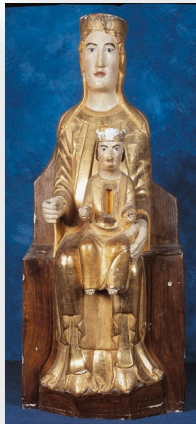
Notre-Dame des Infournats aux confins de l'Aveyron, après Mirandol-Bourgnonac

Tu connais les dangers, protège-moi. Protège aussi mes parents, mes amis, tous ceux que j'aime, et pourquoi pas aussi, ceux qui ne m'aiment pas. Je les confie tous à ton amour maternel.