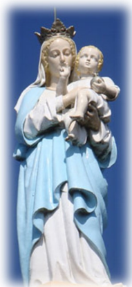
Notre-Dame du Puy de Bar Près de Moularès