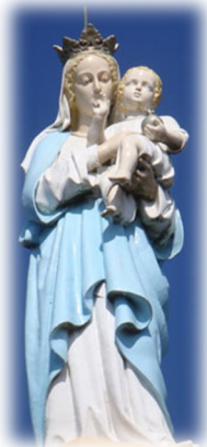
Notre-Dame du Puy de Bar Près de Moularès