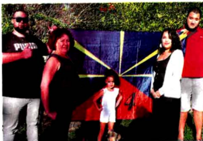
• Parmi les habitants du carmausin, beaucoup de réunionnais.

Pratiqué par une minorité de Réunionnais d'origine chinoise, la plupart s'étant convertis au christianisme. Il fût importé au milieu du 19 e siècle par les premiers Chinois de l'île, travailleurs agricoles. Les bouddhistes comptent très peu de lieux qui leur sont dédiés sur l'île. Des pagodes permettent aux Réunionnais d'origine chinoise, souvent de la région de Canton, de pratiquer le culte des ancêtres. Un petit monastère existe à Saint-Pierre.