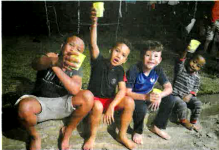
• À la Réunion la population est plus jeune qu'en Métropole.

La meilleure période pour visiter la Réunion est l'hiver austral, de juin à septembre ainsi que les mois de mai et d'octobre pendant lesquels vous bénéficierez de faibles précipitations et de températures clémentes. La vie sur place est généralement plus chère qu'en métropole pour beaucoup de choses (alimentation, santé, communications...) Les billets d'avion sont souvent onéreux, mais on trouve facilement des vols depuis Paris à des tarifs abordables !