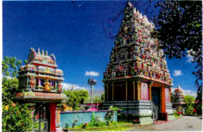
• Temple Hindou du colosse à Sainte André.

À la Réunion, les religions tamoule et hindoue ont été importées à la fin du 19 e siècle par les immigrants tamouls et malabars qui vinrent travailler sur les champs de canne à sucre. Il existe une dizaine de grands temples hindous et de nombreux autres lieux de culte de plus petite taille. Le temple Tamoul de Bois Rouge et le temple du Colosse sont probablement les plus beaux et les plus colorés.