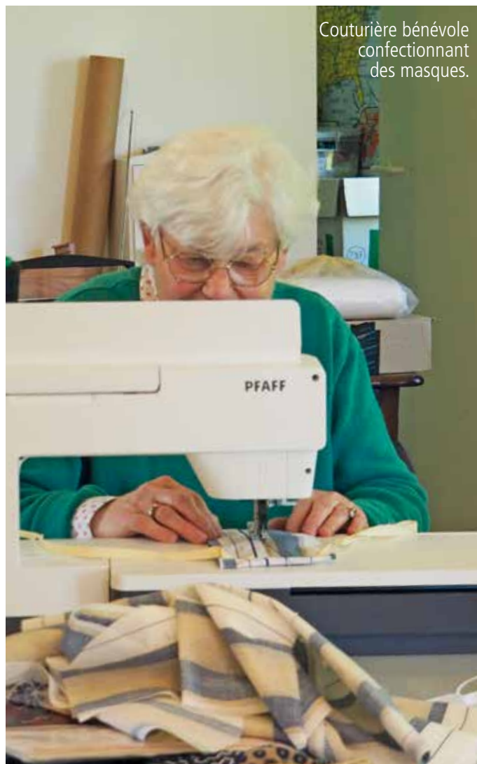
Couturière bénévole confectionnant des masques.