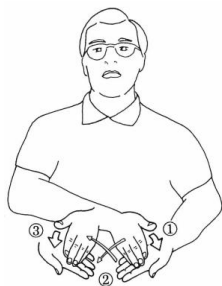
Dessin de Y. Delaporte

1) « La paix » : les deux mains imitent une poignée de main entre deux amis ; la main droite se pose sur la paume de la main gauche tournée vers le haut puis, après un léger déplacement, c'est la main gauche qui se pose sur la paume de la main droite, celle-ci tournée vers le haut. Ce geste provient de l'ancienne Langue des Signes Française, qui s'est maintenu uniquement dans la liturgie et dans l'actuel signe « association ».